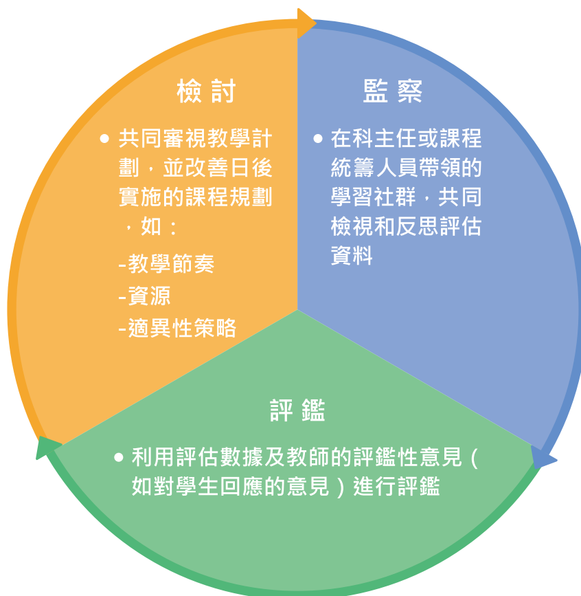
圖 6.3 中觀層面的課程監察、評鑑和檢討